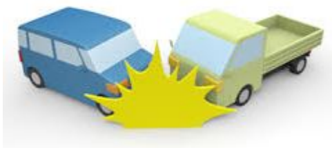
【事故に関わる関係者】

こんにちは。当社の理念を共有するクレドコンパは、「安全の確保」をテーマにスタッフと話し合いを行いました。50台の車両を所有する当社にとって、事故に対する意識を高めることはとても重要なことです。 【事故の追体験】 コンパの流れとして、今までの当社の重大事故2つを共有しました。そのうちの1つは私の事故体験です。 今からちょうど10年前に、私は当社に入社しました。3ヶ月間の試用期間を経て、法人営業部に配属されます。当時、まだ私には営業車の